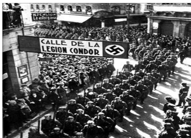
Homenaje de despedida de la FET y de las JONS a la Legión Cóndor en León (1939).

A.3 (4,5 puntos) TEMA: El reinado de Isabel II (1833-1868): las desamortizaciones de Mendizábal y Madoz. De la sociedad estamental a la sociedad de clases.