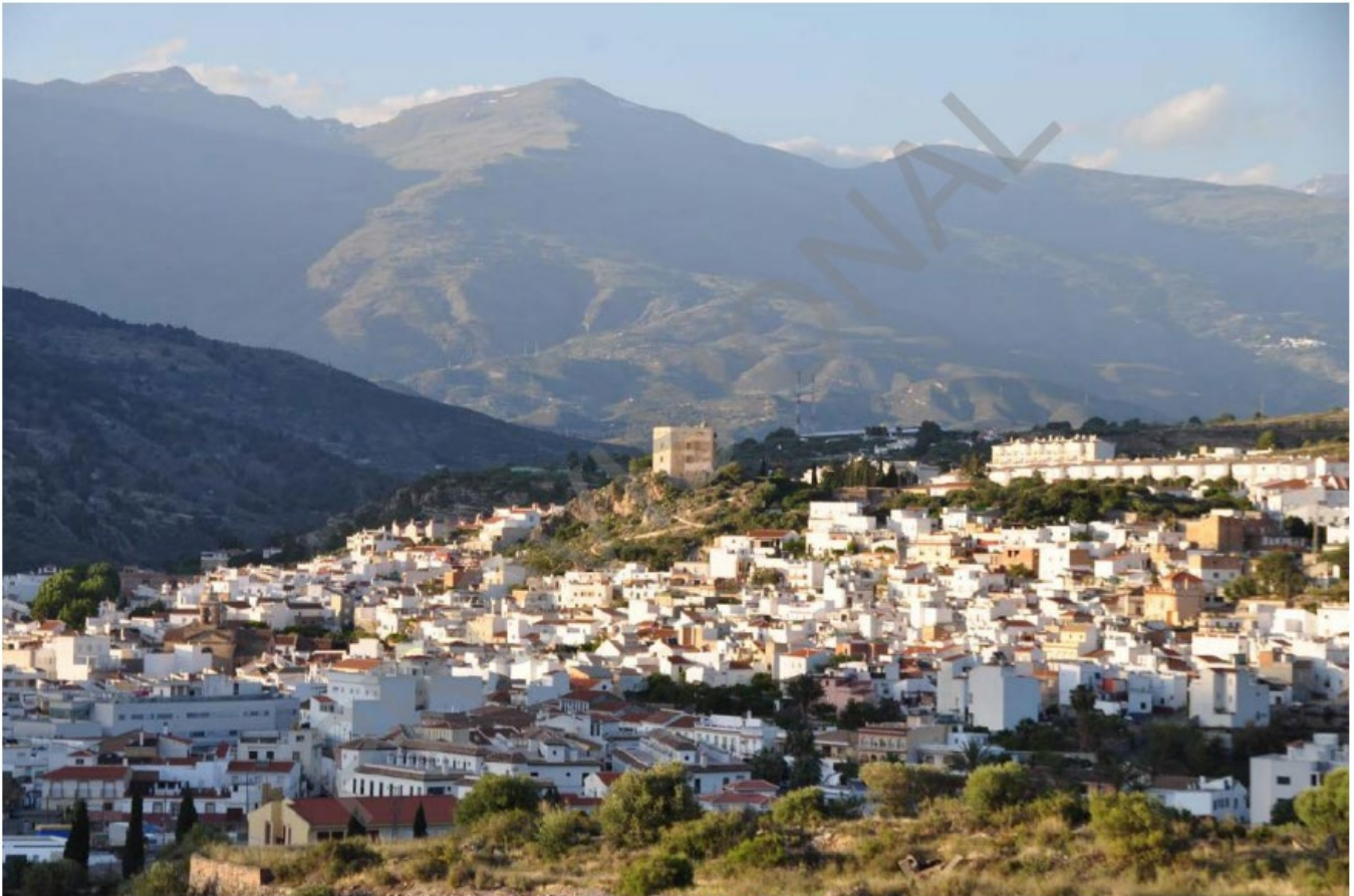
Vélez de Benaudalla (Granada)

Nos encontramos ante un paisaje en el que domina el medio rural insertado en un entorno natural. En él podemos distinguir dos unidades de paisaje, el poblamiento y las elevaciones montañosas. Sus principales características desde un punto de vista geográfico son: