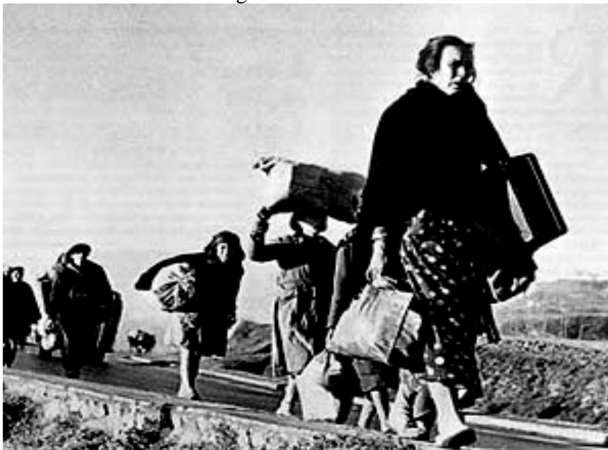
Fotografía de Robert Capa de un grupo de españoles camino del exilio a Francia.

FUENTE HISTÓRICA: Relacione esta fotografía con el exilio durante la dictadura franquista.