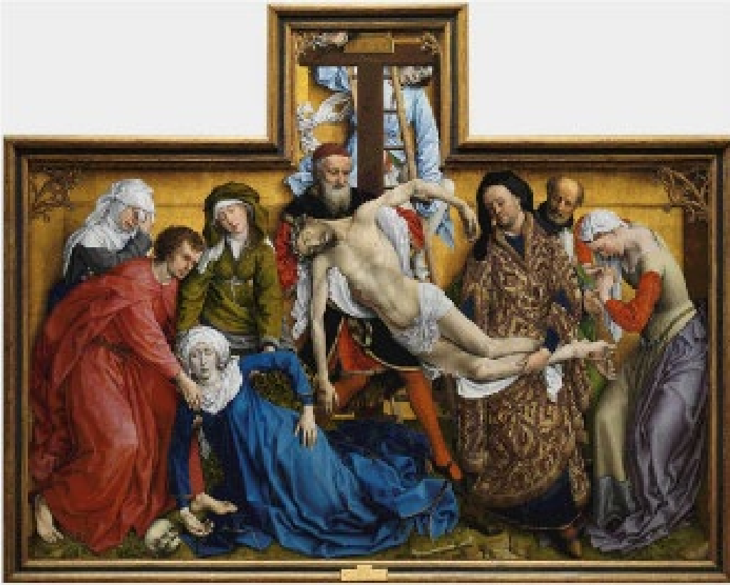
1. El Descendimiento