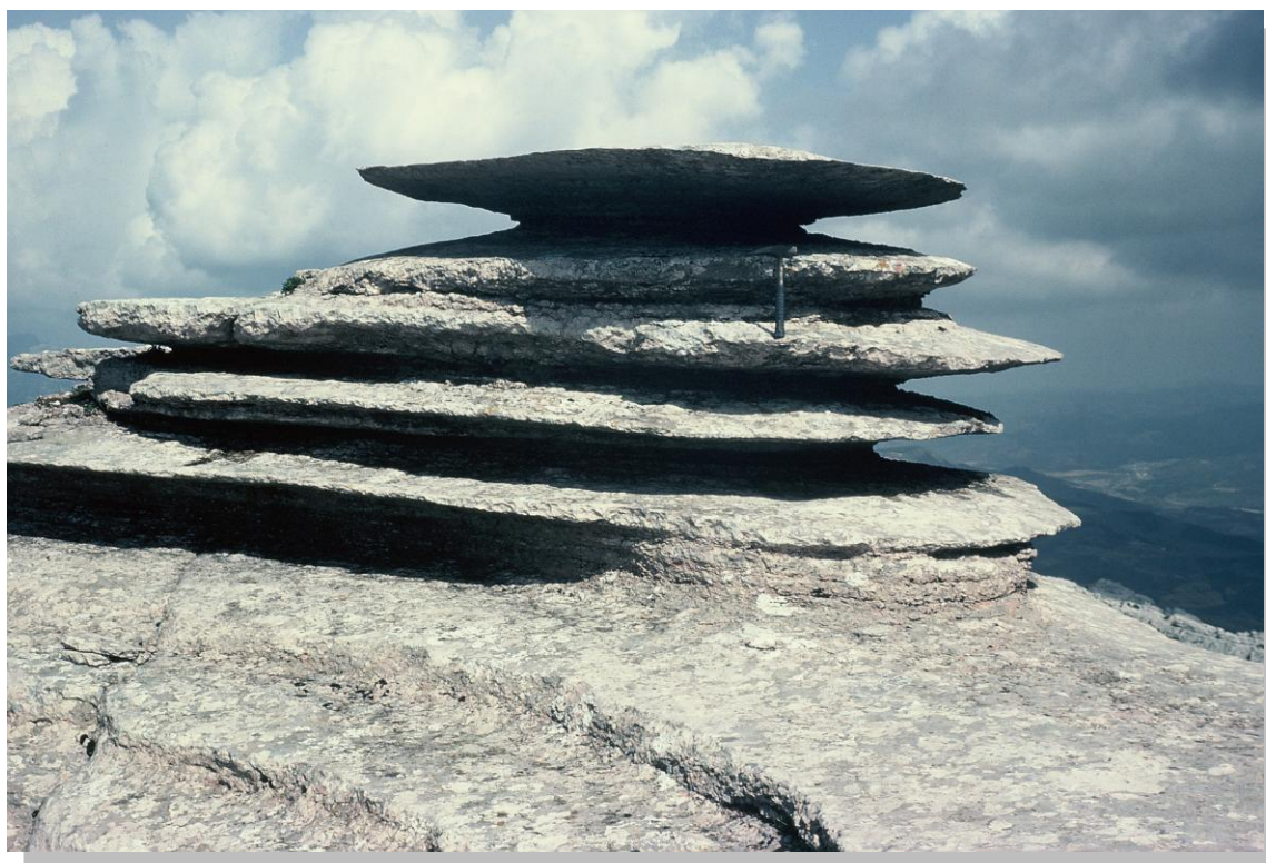
OPCIÓN B. Figura 2

El Tornillo del Torcal de Antequera (Málaga).