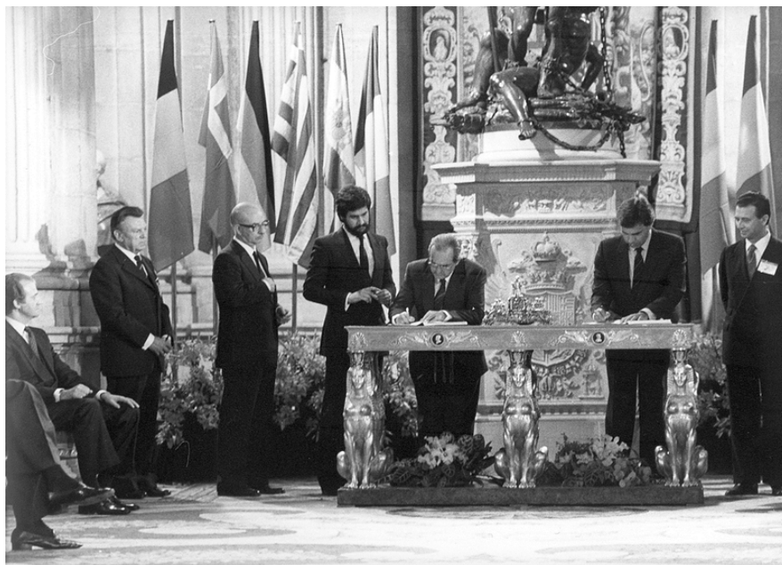
Firma del Tratado de Adhesión de España a la CEE. 12 de junio de 1985. Página web del Ministerio de Asuntos Exteriores y de Cooperación

FUENTE HISTÓRICA: Relacione esta imagen con la integración de España en Europa