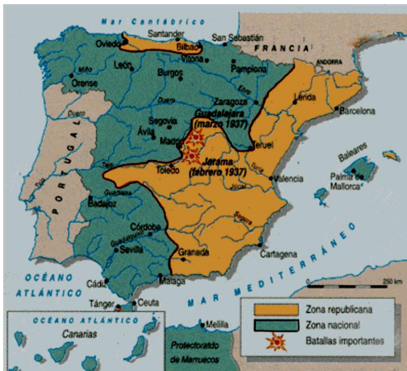
La guerra civil española: situación del frente en marzo de 1937.

FUENTE HISTÓRICA: Relacione el mapa siguiente con el desarrollo de la guerra civil española.