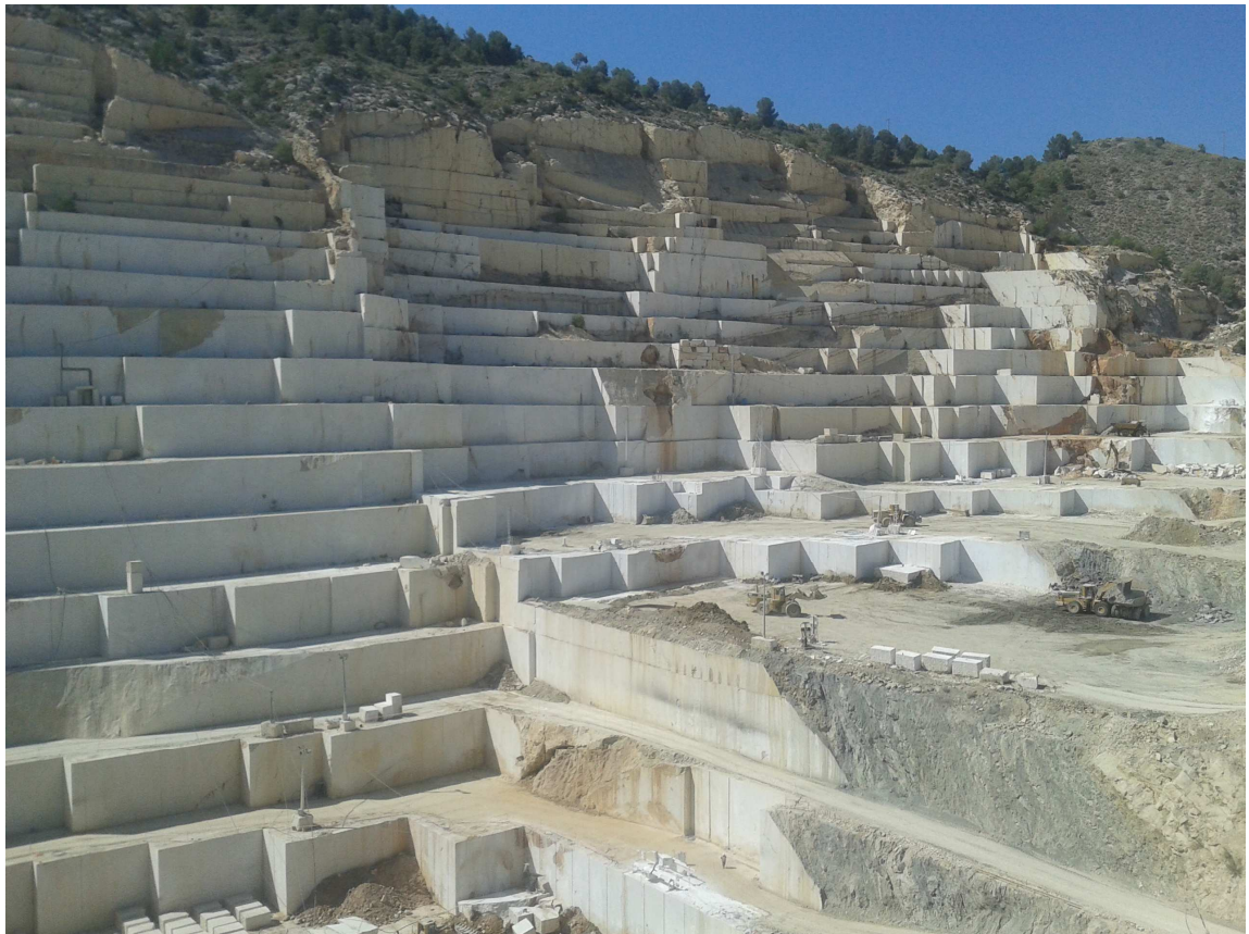
Imagen 2. OPCIÓN B

Explotación de caliza en Cehegín (Murcia)